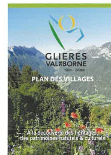
Un plan des villages est disponible en Mairie et à France Services.